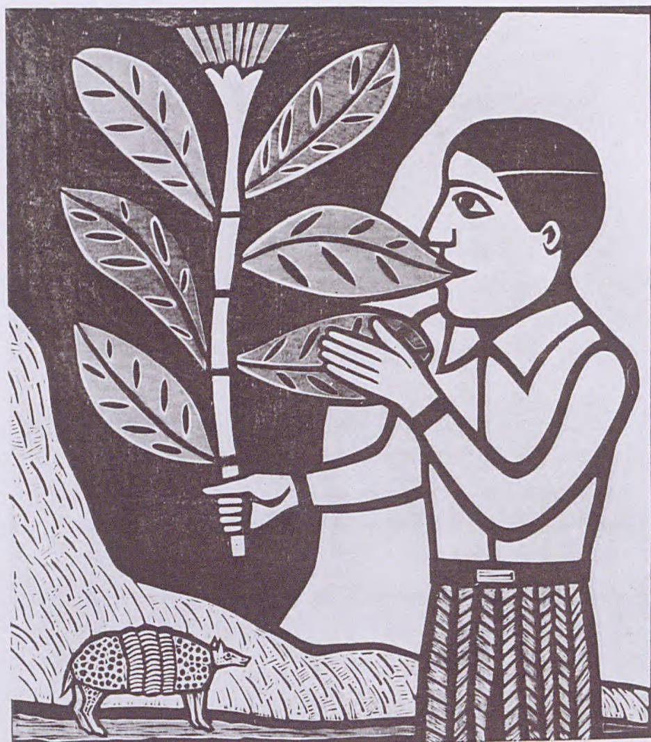
GILVAN JOSE MEIRA LINS SAMICO Comedor de Folhas - 1962 Xilografia a cores - 47,9 x 42,3